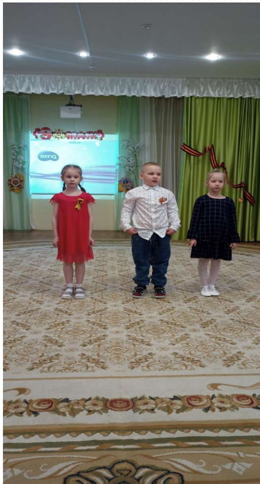
Песня «Мы хотим, чтобы не было больше войны!»