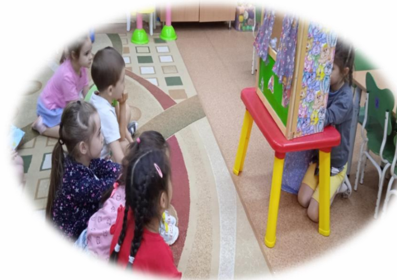
Материал подготовила воспитатель: Семенова Л.П.