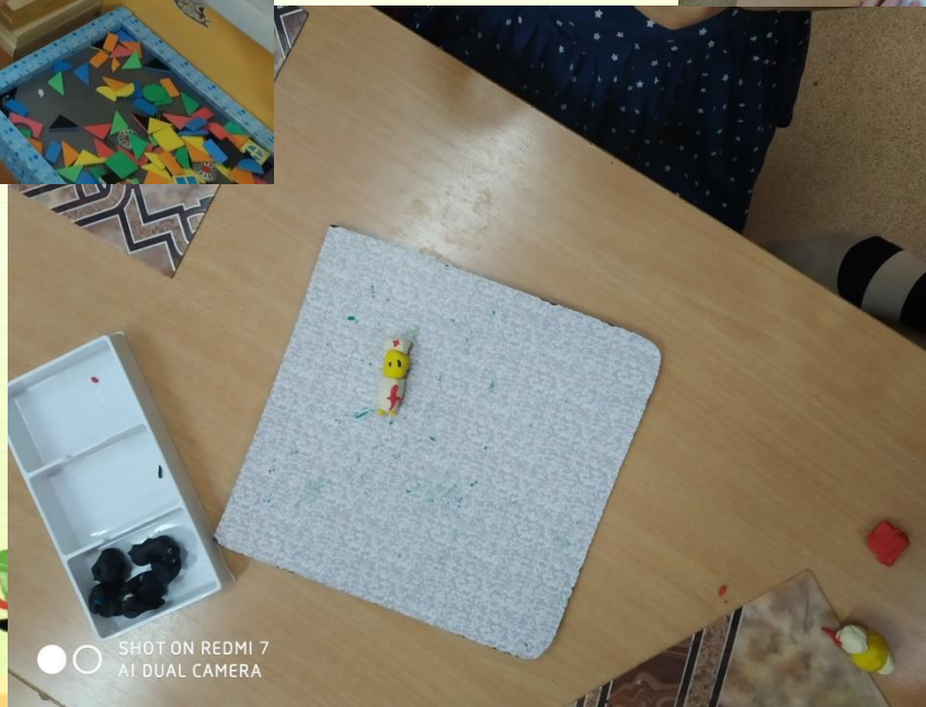
SHOT ON REDMI 7 AI DUAL CAMERA