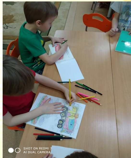
SHOT ON REDMI 7 AI DUAL CAMERA