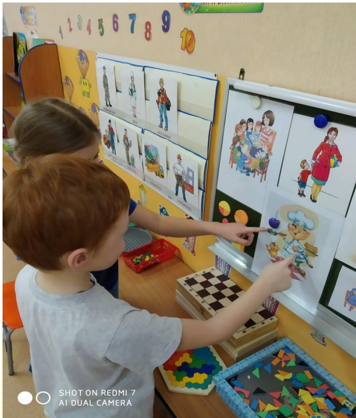
SHOT ON REDMI 7 AI DUAL CAMERA