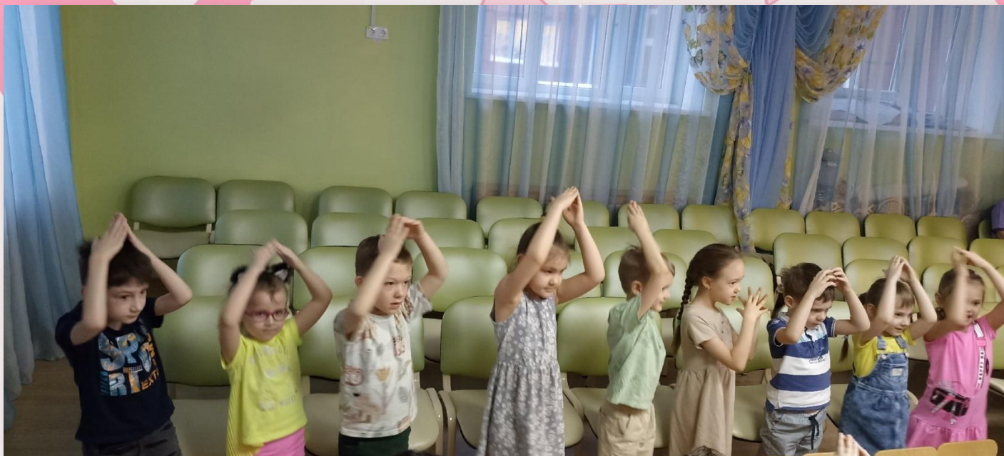
На спектакле дети играли в игры и весело танцевали.