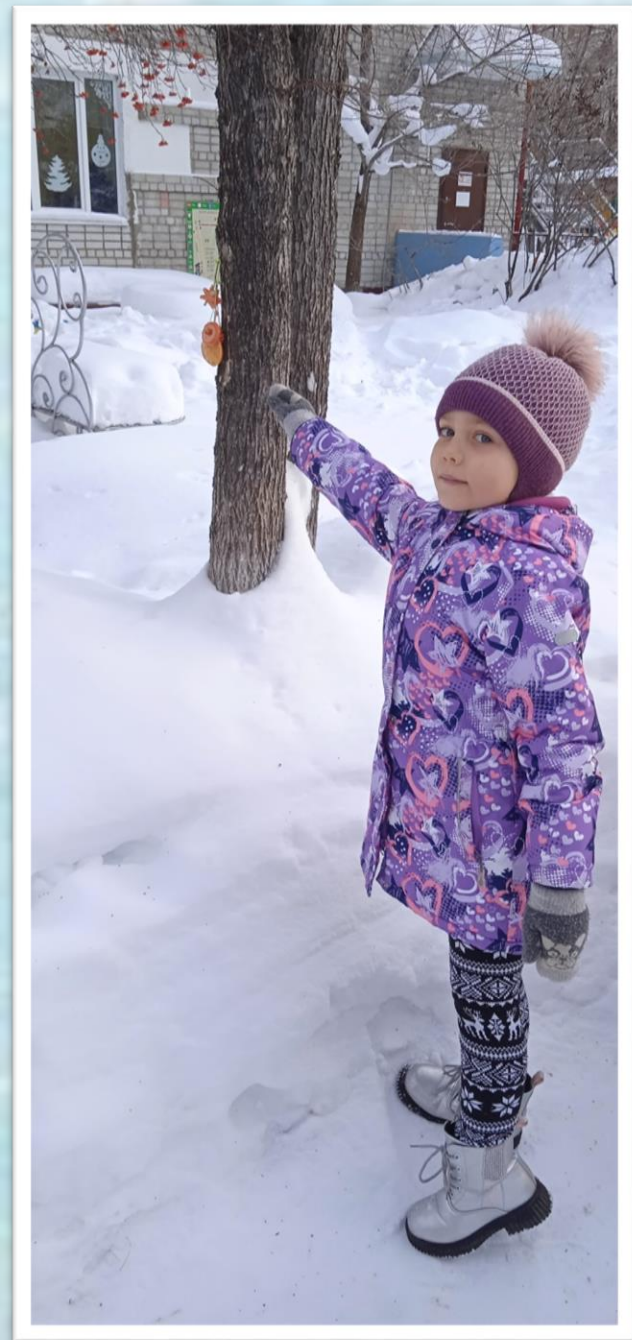
Материал подготовила воспитатель: Семенова Л.П.